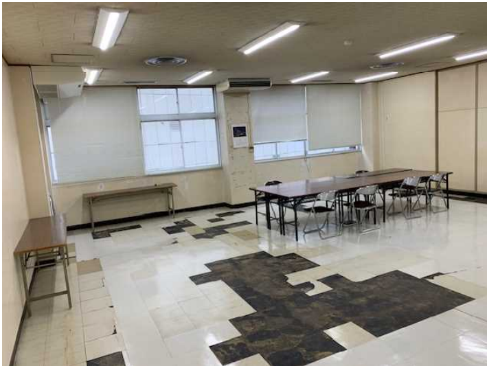
中央を間仕切って利用 (10坪)