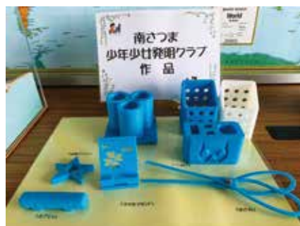
3Dプリンターを活用して制作された作品の例