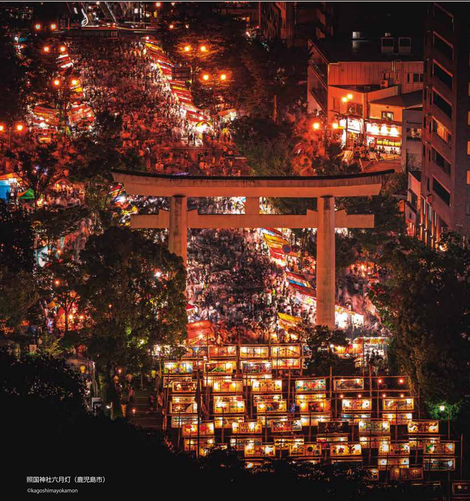
照国神社六月灯（鹿児島市）